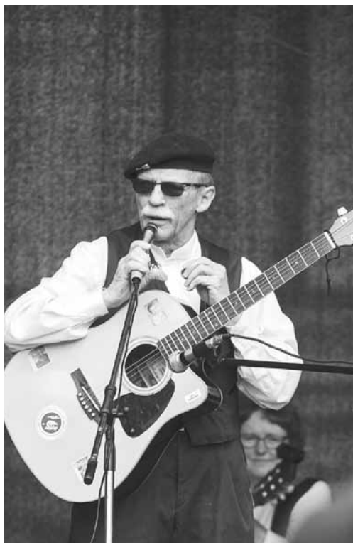
Mies ja kitara eli kitaristi.

Vähin erin hän alkoi tehdä myös omia sanoituksia ja sai tuoreita kappaleita myös