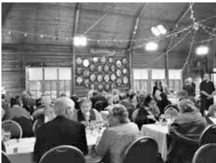
Juhlayleisöä historiallisessa Berghyddan nuorisotalossa.